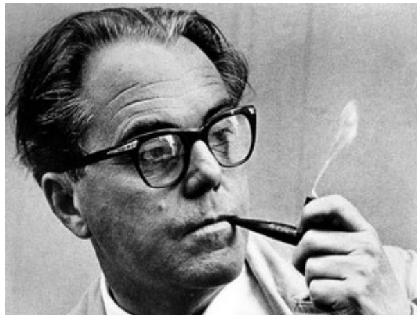
Max Frisch (۱۹۹۱ - ۱۹۱۱)

((بەها مانای ئەووە یه بتوانیت هەلبژیریت!))