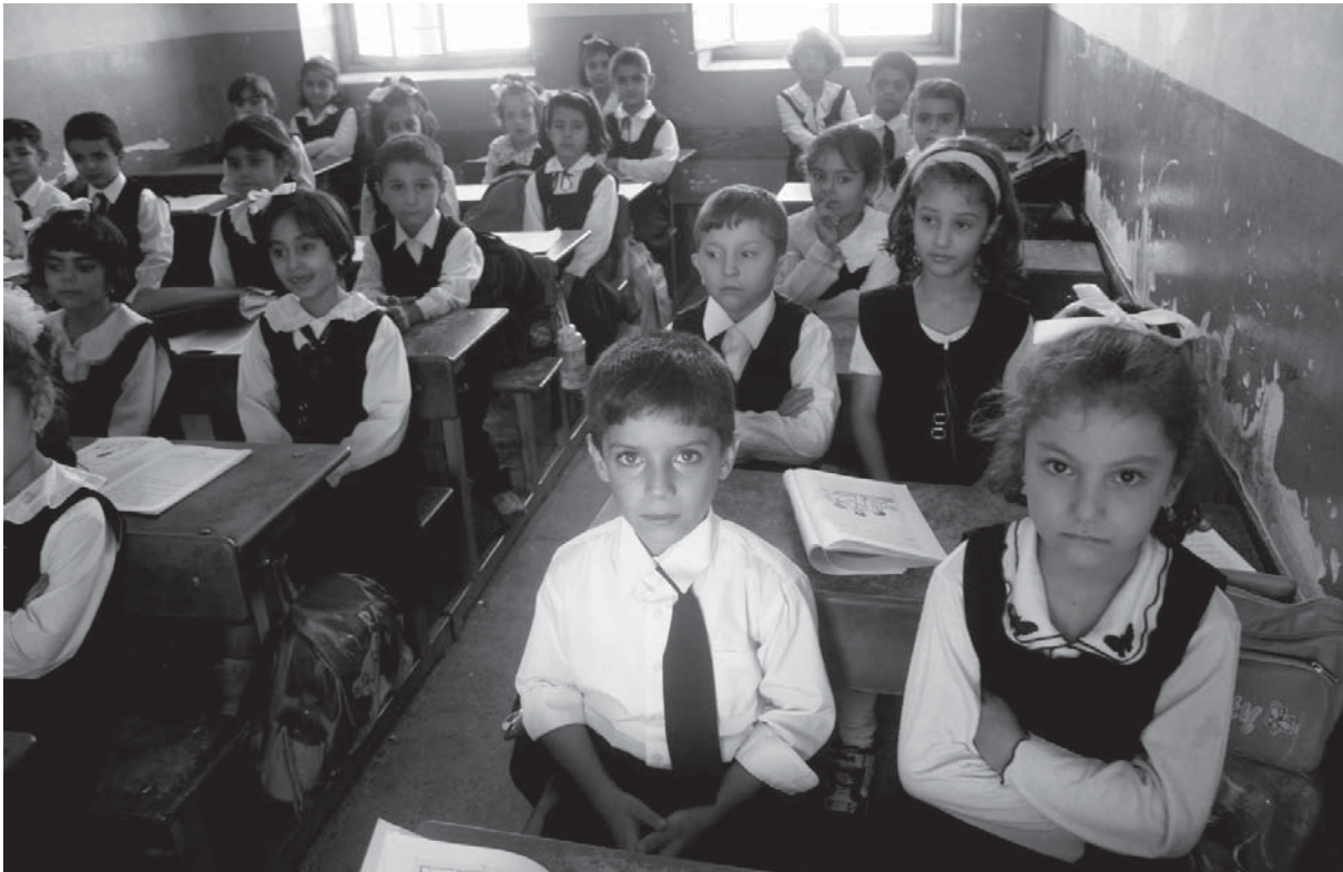
خویندکارانی پۆلیکی خویندنگه‌یه‌کی کوردستان

زراوت: له خزمه‌تگوزاری بینه‌شین) ناوی شه‌ش گوند هاتوو، که نه خویندنگه و نه ریگه‌وبانیان هه‌یه، نه کاره‌با. که‌نده‌که‌وه، له‌سه‌ر جاده‌ی سه‌ره‌کیی سلیمانی، تاسلوجه/که‌رکوک، نه پردیک، نه تونیلێک بۆ په‌رینه‌وه نییه. دانیشتوانی گونده‌که و ئه‌و مامۆستایانه‌ی له سلیمانییه‌وه ده‌چن بۆ ئه‌وی هه‌موو رۆژیک له په‌رینه‌وه‌ی ئه‌و جاده‌یه‌دا، له مه‌رگ نزیک ده‌بنه‌وه (ماوه‌ی سێ هه‌فته، خۆم له‌و بارودۆخدا بووم!)