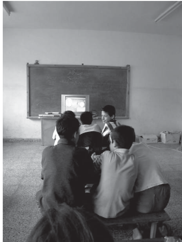
چهند خویندکارێک سهیری یاریی کۆمپیوتەر دهکهن

و ئامادهی ئه نجامدانی راهینان دهبن. بینای خویندنگه و قوتابخانه، کهمه، (وهزیری پهروهردی عیراق به رۆژنامهی ئه لشرق ئه لئه وسه تی له رۆژی ۲۷/۴/۲۰۰۶ دا گووتوه: «عیراق پێویستی به ۵۰۰۰ بینای قوتابخانه هیه!») بهم پێیه بهشی کوردستان به کهرکووک و ناوچه داگیرکراوهکانی دیکه وه، دهگاته ۱۵۰۰ بینا. گووتهکانی بورهان محمه د، به پێوه بهری کارگیری و دارایی وهزارهتی پهروهردی حکومه تی نوێی کوردستان له (رۆژنامهی کوردستانی نوێ له ۲۵/۵/۲۰۰۶دا) سه لمینه ری هه مان بۆچوونه ده لیت: «له وهزاره تی پهروهرده، دوو کیشهی سه رهکی هه یه، که می بینای خویندنگا و پرۆگرامی خویندن.» له گه ل که می بینا، زۆر به یان، گه ر نه لێین گشتیان، به که لک نه ماون، هه یچ مه رجیکه له شساعی و خویندنیان تیدا نییه و بۆ که سانی هاندیکاپ ناگونجین. (بروانه گازهندهیهک له کوردستانی نوێ، رۆژی ۲۹/۵/۲۰۰۶دا نووسراوه، بینای قوتابخانهی دواناوهندی گرده گوزینه له که لار به که لکی خویندن نه ماوه.) له درێژهی گازهنده که دا نووسراوه (له بهر