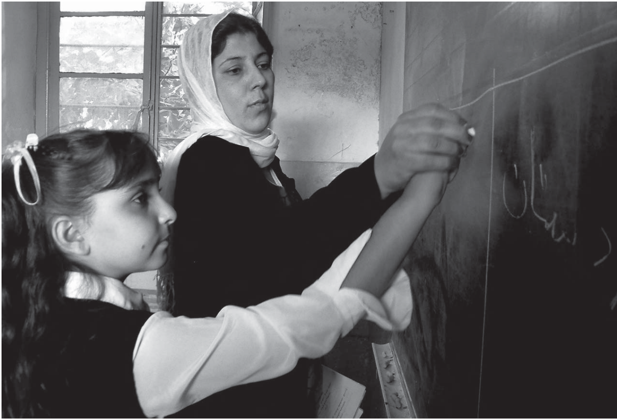
مامۆستا و خویندکاریکی پۆلیکی کوردستان (کامپرای جه‌مال پینجوتینی)

ده‌سته‌لاتدا بن، ئەوا وه‌زاره‌تی په‌روه‌رده، یه‌کیک ده‌بیت له‌و وه‌زاره‌تانه‌ی که بگره و به‌رده‌ی ژۆری له‌سه‌ر ده‌بیت.