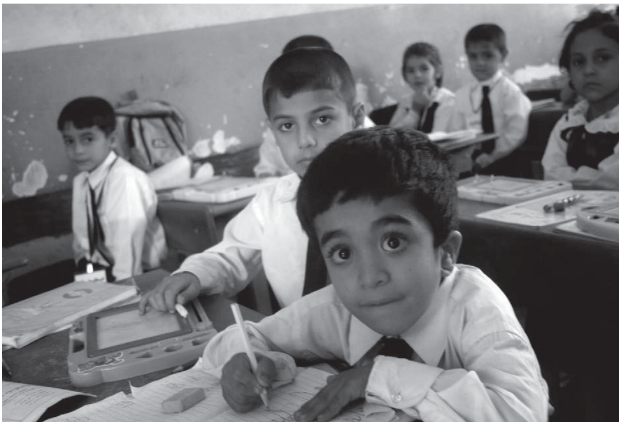
خویندکارانی پۆلیکی کوردستان

پروگرامه‌کانی خویندن به لایانه‌وه گرنگ نین و تهنه چاویان له (دهم و دهستی) مامۆستایه و زانیارییه‌کان راسته‌وخۆ له وهرده‌گرن. له‌بهر ئهم هۆیه، پینگه‌ی مامۆستا زۆر گرنگه و ده‌بیت هه‌رده‌م له ئه‌جندای سیاسه‌تمه‌داران و باواندا بیت که میتۆدی راهیتان و ئاماده‌کردن و زانیاری مامۆستا له‌گه‌ل گۆرانکارییه‌کانی ناو کۆمه‌لگا و جیهاندا، تازه بکریته‌وه. ئه‌و خاله‌ش گرنگه که مامۆستا له تهنه‌ی مندالییدا به‌و بۆچوونه راهیترا‌بیت ریز له سنووری جهسته (بۆدی زۆن) و بیروبۆچوونی کهسانی دیکه بگریته.