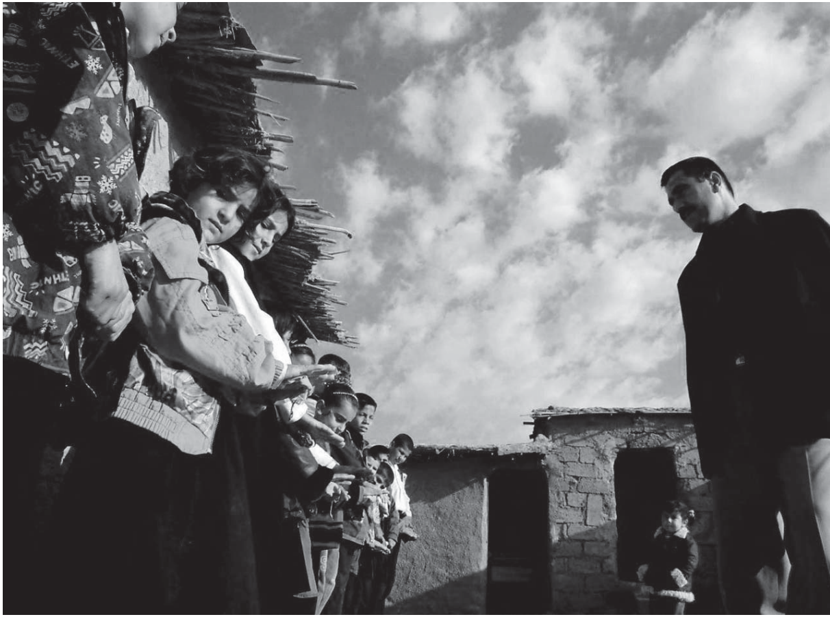
خویندکارانی خویندنگه‌یه‌کی کوردستان له کاتی پشکنینی پاکخواوینیدا

دیموکراتی فیر نه‌کراوه، بۆیه هیچ ریزیک بۆ سنووری جه‌سته‌ی مندال، قوتابی، خویندکار دانانیت. گهرچی به‌پینی یاسایه‌ک، لیدان قه‌ده‌غه کراوه، به‌لام به‌ده‌گه‌من مامۆستایه‌ک ده‌بینیت‌ه‌وه ریز له‌و بریاره بگریت.