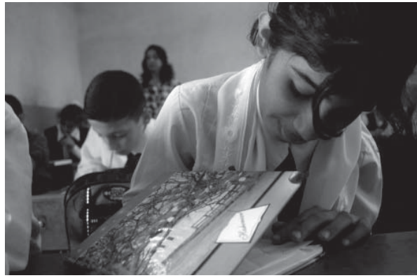
چهند خویندکاریک له خویندنگه‌یه‌کی کوردستان له کاتی تاقیکردنه‌ودا

دیکه‌ی پرؤسه‌که‌یه. گونجاندنی به‌ها دیموکراتیبه‌کان له پرؤسه‌ی په‌روه‌رده و فیرکردندا، بناغه‌ی بنیانتان و گه‌شه‌پیدانی کومه‌لگه‌ی سیفیل و دیموکراته.