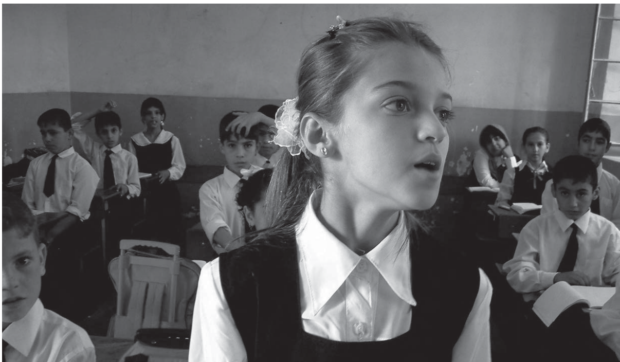
چەند خويندكارىك لە خويندنگەيەكى باشوورى كوردستاندا

پەرورەدە و فيزىكردن لە باشوورى كوردستاندا لە ئاستەنگ و چەلمەيەكى سەختدايە، كاركردن، يان رينمايىكردنى زانستيانە و واقعيانە، لە ھەر يەكەك لە و بوارەندا كەلينيك دەگریت. ديسان مەبەست لەوھيە كە بەتەنها كيشەي پەرورەدە گۆرپنى كتيبەكان نيبە، بەلكو چاككردن و گۆرپنى سەرتاپاي بوارەكانى ديكەى ژيانە. رەنگە گووتەكەى مامۇستا جەمال عەبدول، كە لە ھەمان گووتاردا نووسيوھيەتى، شياوترين گووتە بيت بۇ کوتايى ئەم باسە: «گەشەي فيزىكردن، دەبى بەپيى بنەماي ديدىكى نەتەوھيى بيت و بخريته چوارچيوھى پيشبركى جيهانيەوھ بەو جۆرەى جيهانيانە بىر بەگەينەوھ و خۆماليانە كارى پي بەگەين.» بەيارمەتى مامۇستا جەمال ئەم دەستەوازانەى بۇ زياد دەكەم، گەشەى فيزىكردن دەبيت لەسەر بنەماي ريزگرتن لە جەستە، بيروبوچوون، حەز و ئارەزووى گشت مرؤفيك بيت. دەبيت لەسەر بنەماي خۆشويستن و پاكرگرتنى سروشت و ژينگە بيت. دەبيت لەسەر بنەماي زانست و بىرى فەلسەفى و ئەنديشەى ئەدەبى و ھونەرى بيت.