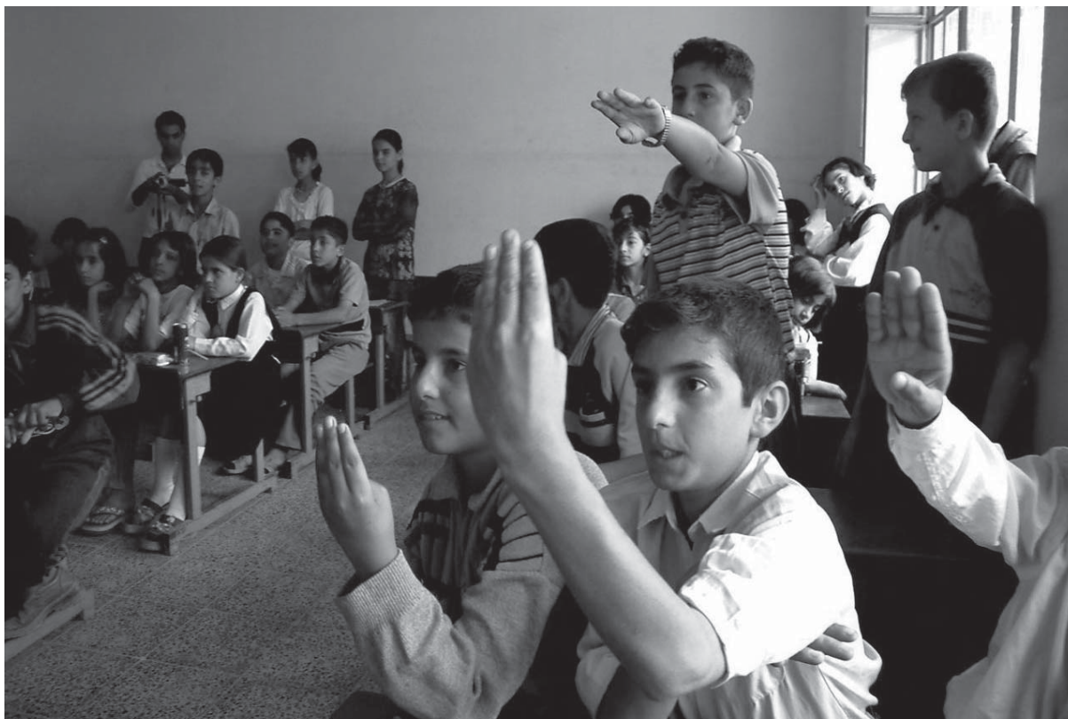
خویندکارانی پۆلیکی کوردستان

دهولت دهبيت لهو فاکته شهوه کار بۆ دابینکردنی لهش ساغی بکات، که کۆی تیچوونی په ره ستاری که سیکي ناساغ و له شهبه بار، هزار به رابه ر له دابینکردنی فاکسین و درمانی دژ به نه خوشییه کوشنده کان گرانتی تیده چیت.