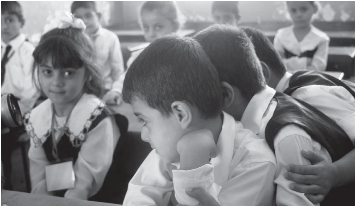
چەند خويندكارىك لە پۆلىكى كوردستاندا

مامۆستای زانستی رامیاری لە زانکۆی سەلاحەدین لەمەر ئەم کیشانەو دەلیت: «هەول دەدم خويندکاران هان بەدم بۆ دەستیکردنی توژینەو، بیرکردنەو و گفتوگۆکردن، ئەو ئاسان نییە، چونکە لە کوردستان خويندکاران تەنها بە شیوازی لەبەرکردن راھاتوون، کە من دەستم کرد بە کار لێرە، کتیبیکیان دامی لە سالی ۱۹۸۲دا دانرابوو. لە راستیدا هیچ سەرچاوەیەکی زانستی لەبارەى رامیارییەو نییە، توژینەو زۆر کەمە و زۆربەى مامۆستاگان دەوامیکى رۆتینی دەکەن، بەنیسبەت خويندکارەکانەو زۆربەیان فێر نەبوون گفتوگۆ بکەن و بە رەخنەو سەیری بابەتەکان بکەن، ئەزانم ئەمە خەتای ئەوان نییە، چونکە لە قوتابخانە تەنها بە لەبەرکردن فێر کراون، وشە بە وشەى کتیبیک، یان قسەى مامۆستا لە بەر بکەن. زۆربەى مامۆستاگانى زانکۆش چاوەڕپى ئەوەن خويندکار بابەتەکان لە بەر بکەن، بەگشتى لە کوردستاندا کولتوورى رەخنەگرتن نییە و لێدوانى رەخنەگرانش بە دوژمنایەتى دەزانریت.» (هەفتەنامەى بەیانى، ژمارە ۱۰/۹/۲۰۰۶). لەگەڵ ئەمەشدا رژیمی تاقیکردنەو بۆ هەموو قوتابخانەکان، بەتایبەتى سەرەتایی، هیچ پێوەریکی زانستیانی نییە بۆ خەمڵاندنی