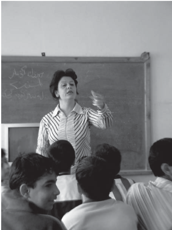
مامۆستای پۆلیک له کاتی وانهواتنه وهدا